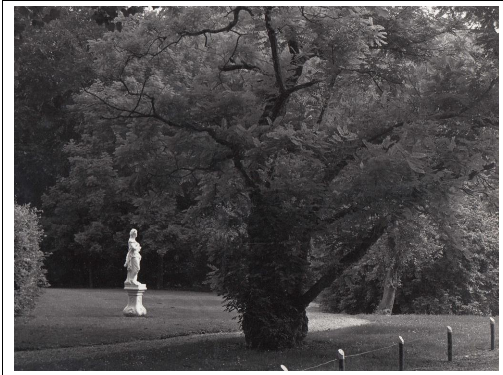
In serene rust staat het beeld in de tuin van het Slot. De haag achter het beeld staat er nog. Het scheidt het grasveld met de speeltuin.

Toen het Slot nog gemeentehuis was, bevonden zich in de tuin twee beelden: Flora en Pomona genaamd. Door vandalisme zijn de beelden op een gegeven moment in de gracht terecht gekomen.