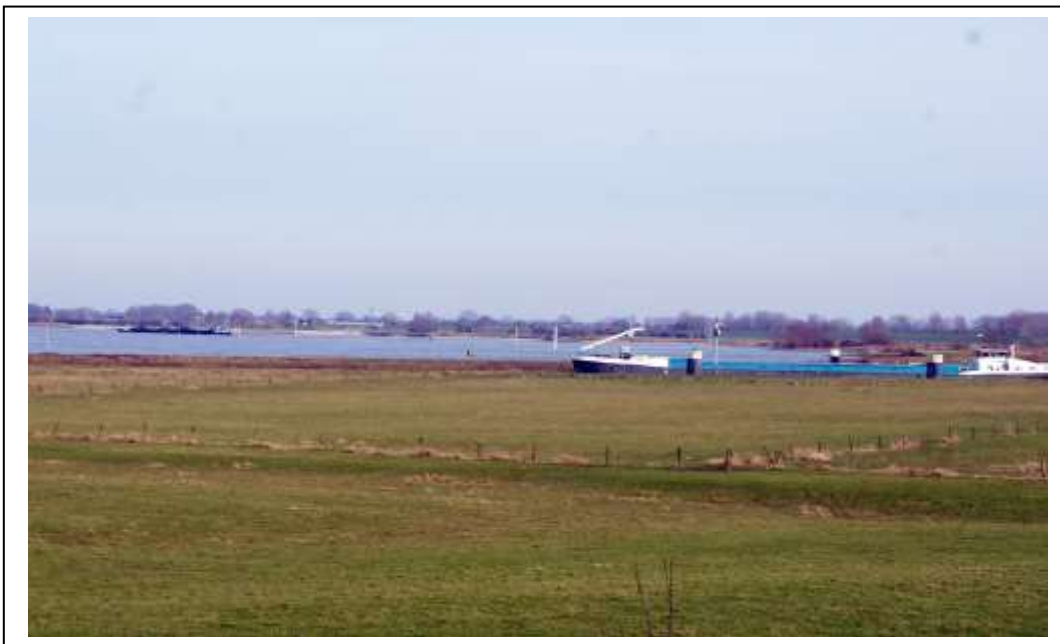
de uiterwaarde waar het klooster Mariënakker zich bevond; de fundamente zijn onder een dikke laag klei verdwenen

'Toen Mondragon na het beleg van Bommel in 1599 zich te Rossum verschanste, wierp prins Maurits aan de overzijde van de Waal versterkingen op en had het klooster van het geschud veel te lijden. Het volgende jaar maakte prins Maurits van het klooster een schans tegen het fort Andries waaruit de Spanjaarden de gebouwen in den grond schoten en niets dan puinen overlieten. Om de geheele verwoesting te voltooien verlegde men den keerdijk, en bragt het kloosterterrein buitendijks, zoodat de rivier daarop jaarlijks slibbeddingen kwam neerleggen en de fundamentendiep bedekken. Sedert het begin dezer eeuw heeft de Waal, door een veranderden stroom, den uiterwaard zoodanig weggeslagen, dat in lateren tijd aan de steilen rivieroever de puinen van het oude Mariënakker zijn zichtbaar geworden, die meestal een middeleeuwschen bouw aanduiden. Men is hierdoor tot de veronderstelling geregtigd in deze puinen een der oudste kloosters van ons land te aanschouwen.